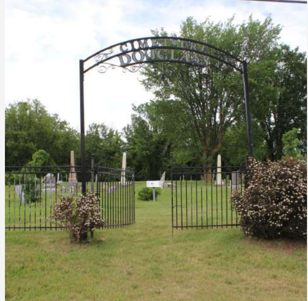
Cimetière Douglass Saint-Cyprien-de-Napierville