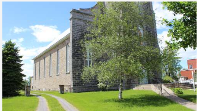
Église de Saint-Bernard-de-Lacolle (1867)