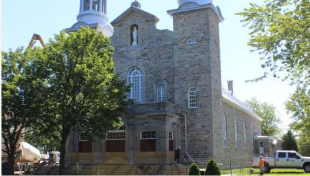
Église de Saint-Rémi (1836-1840)