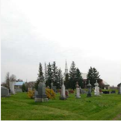
Cimetière catholique Saint-Jacques-le-Mineur