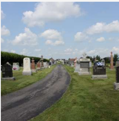
Cimetière catholique Saint-Édouard