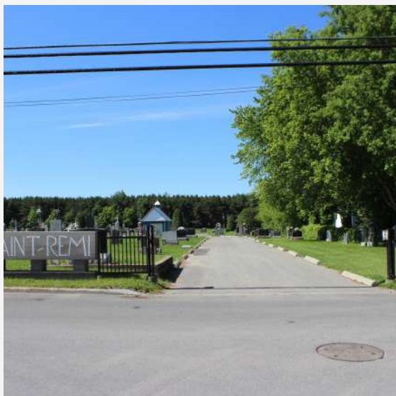
Cimetière Catholique Saint-Rémi

Les cimetières sont des lieux importants pour les paroissiens qui y trouvent le repos éternel ou pour ceux qui s'y recueillent en commémoration du décès de leurs proches. La plupart des cimetières retrouvés sur le territoire de la MRC sont adjacents à l'église, mais d'autres sont plus isolés ou à l'écart du village. Parfois, ils sont ceints d'un muret de pierre ou d'une clôture et leur entrée se distingue souvent par un portail en pierre et en fer forgé. Les monuments et pierres tombales de différents formats et de formes diverses, selon les époques de leur érection, parsèment ces vastes étendues verdoyantes.