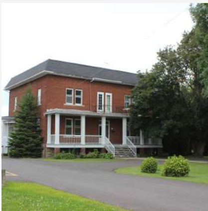
Ancien presbytère Saint-Michel