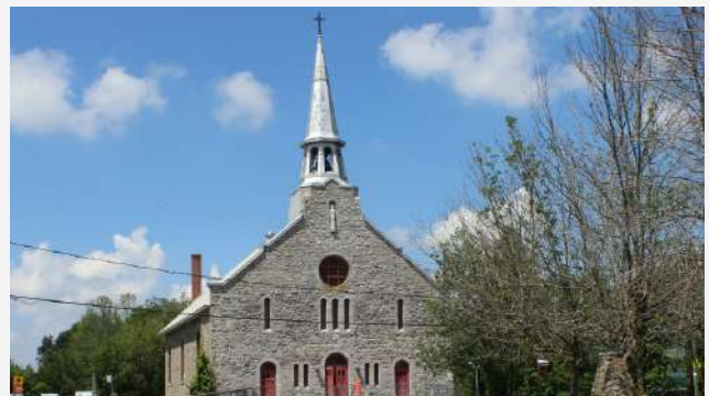
Ancienne église Saint-Jacques (1938) Saint-Jacques-le-Mineur