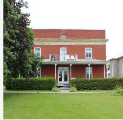
Ancien presbytère (Vers 1920) Saint-Patrice-de-Sherrington