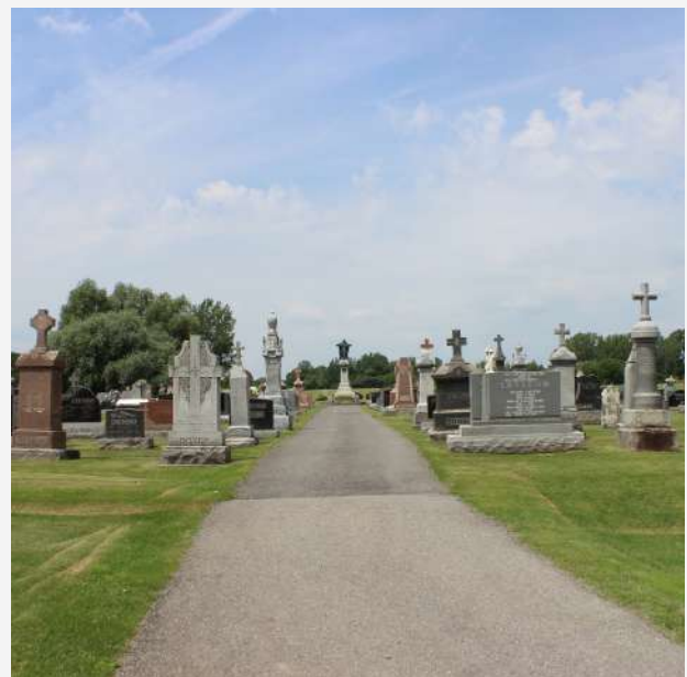
Cimetière catholique Saint-Michel