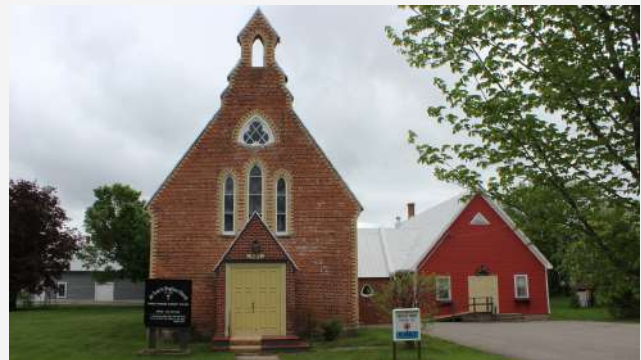
Saint Luke Anglican Church (1859-1880) Hemmingford Village