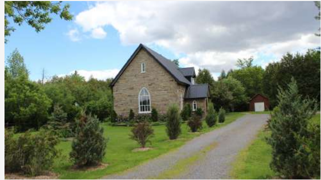
Ancienne Saint John the Baptist Anglican Church (1856) Saint-Bernard-de-Lacolle