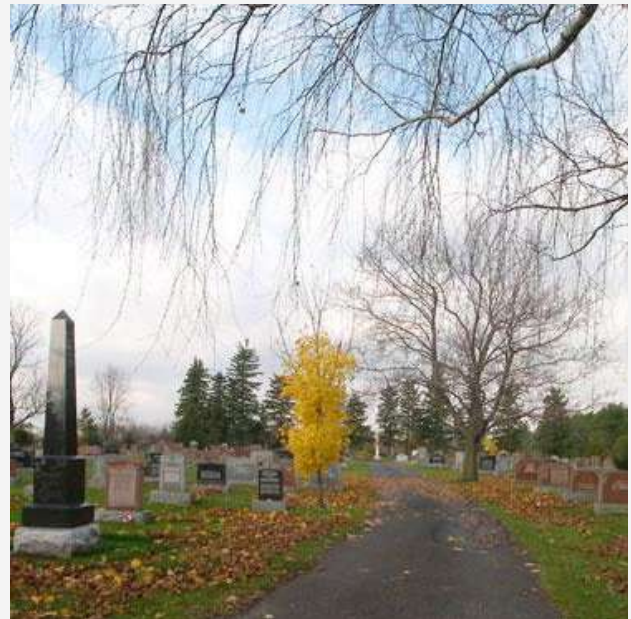
Cimetière catholique Saint-Romain Hemmingford Village

Les symboles sont particulièrement riches dans l'ornementation des stèles funéraires. La croix, les anges, les urnes, le tombeau, les mains, la bible sont les symboles les plus couramment utilisés dans les rites mortuaires. Certains cimetières comportent des éléments particuliers tels des mausolées, un charnier, des croix monumentales, des statues, un calvaire, etc.