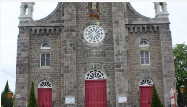
Église Saint-Romain (1893-1894) Hemmingford Village