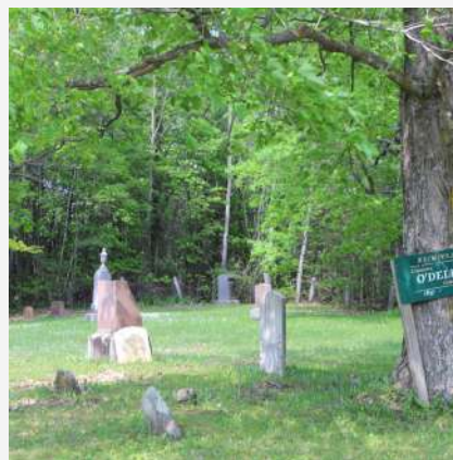
Cimetière O'Dell McKay Hemmingford Canton