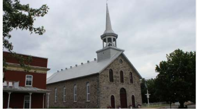
Église Saint-Patrice (1855-1856) Saint-Patrice-de-Sherrington