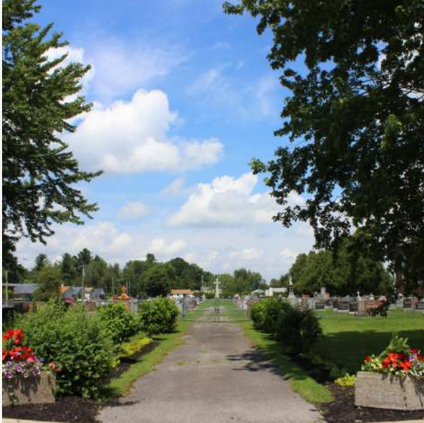
Cimetière catholique Sainte-Clotilde