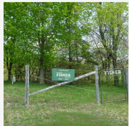
Cimetière Fisher Hemmingford Canton