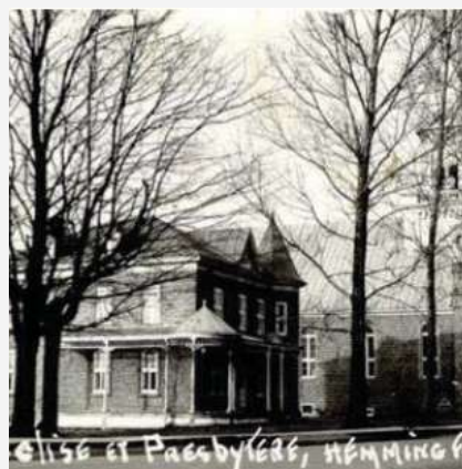
Presbytère Saint-Romain Photo d'époque (BANQ)