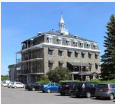
Ancien couvent Sainte-Anne (1880) Napierville

Les couvents sont habituellement de vastes édifices hauts de quelques étages, parfois de plusieurs, installés dans le noyau villageois, à proximité de l'église et du presbytère. Ces bâtiments doivent être suffisamment grands pour accueillir un bon nombre d'élèves des classes élémentaires et secondaires, pour offrir le gîte à plusieurs pensionnaires et pour loger les membres des communautés religieuses qui en sont propriétaire. En plus de leur mission éducative, certaines congrégations assurent également des soins hospitaliers et de charité; ainsi des orphelins, des malades et des personnes âgées vivent dans ces établissements.