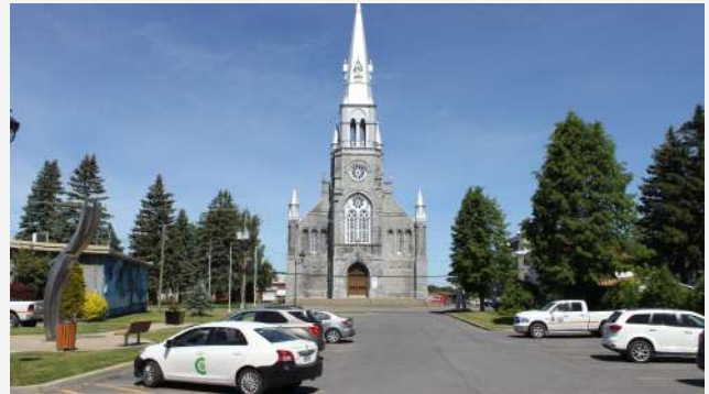
Église Saint-Cyprien (1887-1889) Napierville