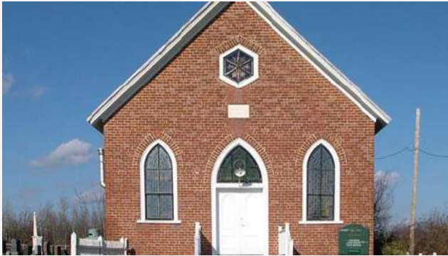
Wesley-Knox United Church (1873) Hemmingford Canton