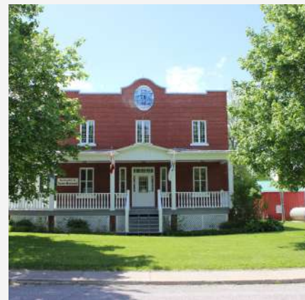
Ancien presbytère, hôtel de ville Saint-Bernard-de-Lacolle