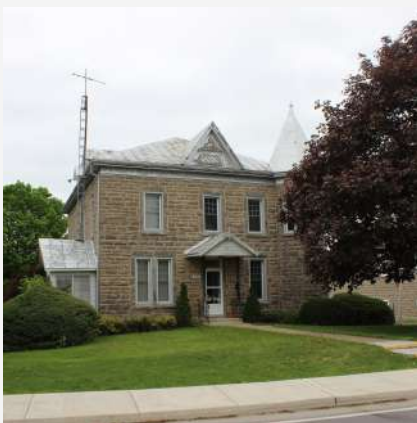
Presbytère Saint-Romain Hemmingford Village