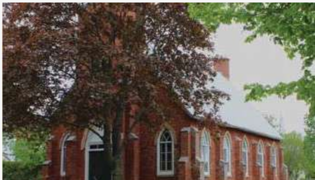
Saint Andrew Presbyterian Church (1823) Hemmingford Village