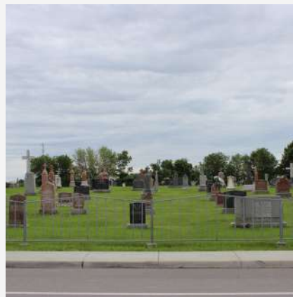
Cimetière catholique Saint-Patrice-de-Sherrington