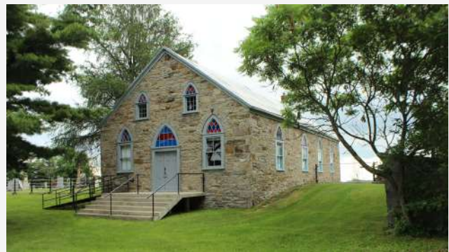
Beechridge Presbyterian Church (1818) Sainte-Clotilde