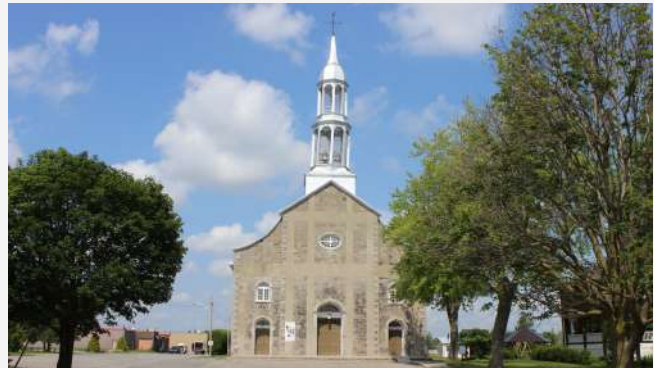
Église de Saint-Édouard (1831)

On retrouve neuf églises catholiques sur le territoire de la MRC. La plupart anciens, monumentaux ou plus modestes, ces lieux de culte sont omniprésents dans le paysage et occupent bien souvent la place centrale dans les noyaux villageois comme le veut la tradition chez les catholiques. Les plus anciennes églises ont été construites dans le premier tiers du XIXe siècle et témoignent de la volonté des habitants de se doter de temples majestueux. Deux églises ont d'ailleurs été érigées avant même la création du diocèse de Montréal en 1836, à l'époque où le territoire était sous l'autorité du vaste diocèse de Québec. Certaines des plus anciennes paroisses ont remplacé les premiers temples religieux devenus désuets ou insuffisants pour répondre à la croissance de la population, ou qui ont été la proie des flammes.