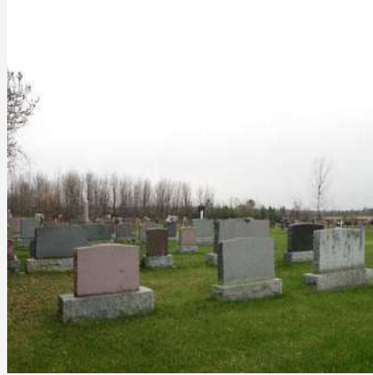
Cimetière catholique Saint-Bernard-de-Lacolle