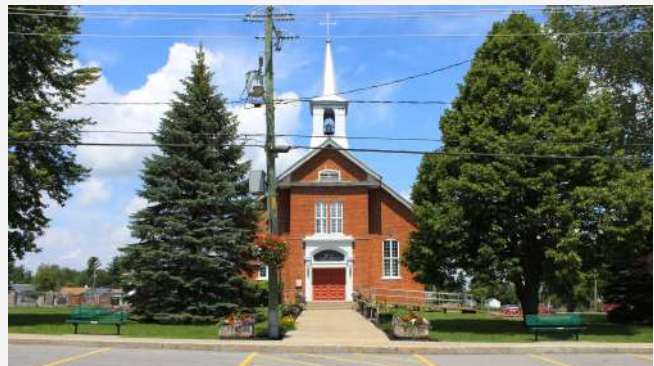
Église de Sainte-Clotilde (1884-1886)