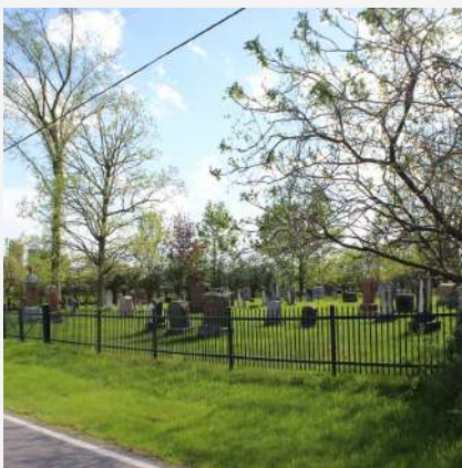
Cimetière Roxham Saint-Bernard-de-Lacolle