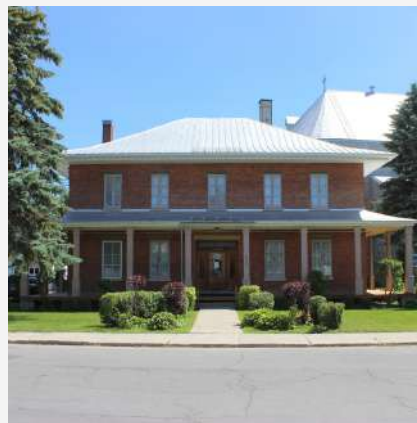
Presbytère Saint-Cyprien (1856-1857) Napierville