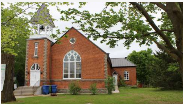
Ancienne Saint Andrew's Presbyterian Church (1890-1893) Coop de Solidarité-Santé Hemmingford village