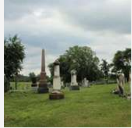
Cimetière presbytérien Beechridge, Sainte-Clotilde