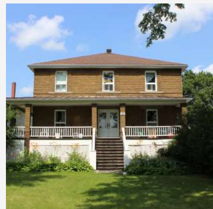
Ancien presbytère Saint-Édouard