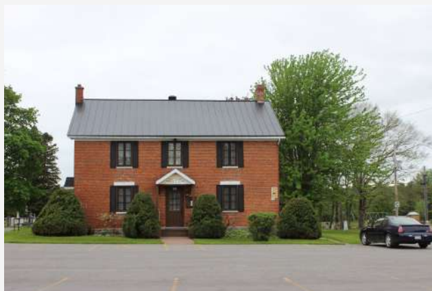
Vieux-Couvent Hemmingford Village