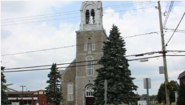
Église Saint-Michel-Archange (1836-1840) Saint-Michel