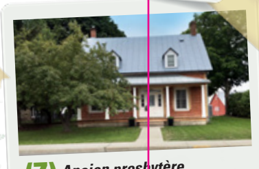
(7) Ancien presbytère de l'Église Unie