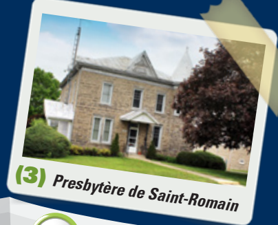
(3) Presbytère de Saint-Romain