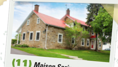
(11) Maison Scriver