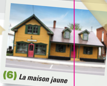
(6) La maison jaune