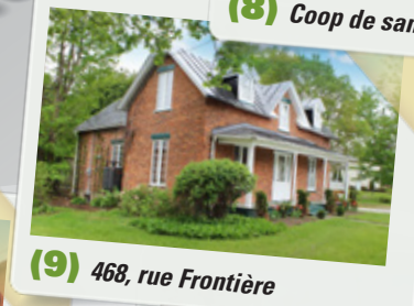
(9) 468, rue Frontière