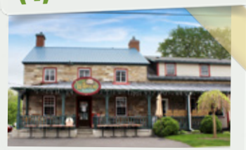
(5) Ancienne maison de W. Scriver