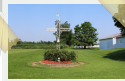
(7) 208, rue Principale