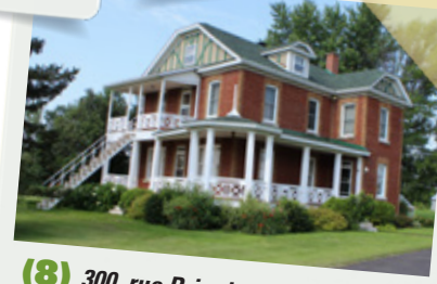
(8) 300, rue Principale

Comme la plupart des municipalités de la MRC des Jardins-de-Napierville, la municipalité de Saint-Édouard possède une longue tradition agricole. Les cultures y sont diversifiées, mais celle de la pomme de terre y réussit particulièrement bien. De plus, l'industrie laitière y est fortement représentée, ainsi que des industries spécialisées dans l'élevage et la commercialisation des caillies. Les résidents de Saint-Édouard sont reconnus pour s'impliquer dans leur milieu communautaire.