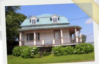
(4) 60, rue de l'École