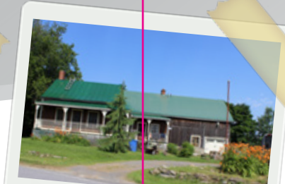
(6) 188, rue Principale