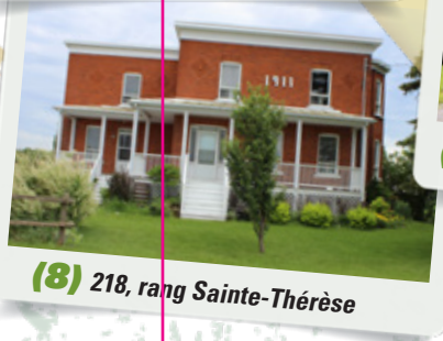
(8) 218, rang Sainte-Thérèse