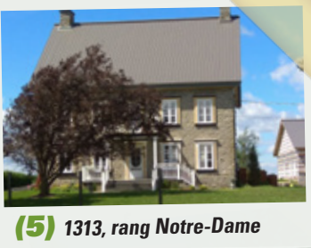
(5) 1313, rang Notre-Dame