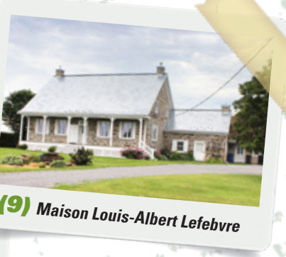
(9) Maison Louis-Albert Lefebvre

patriotes. Le 30 juin 1859 eût lieu l'érection civile du village en corporation municipale.