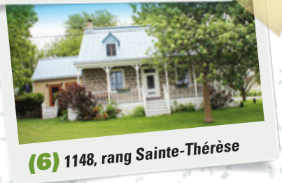
(6) 1148, rang Sainte-Thérèse