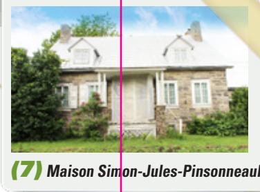
(7) Maison Simon-Jules-Pinsonneault