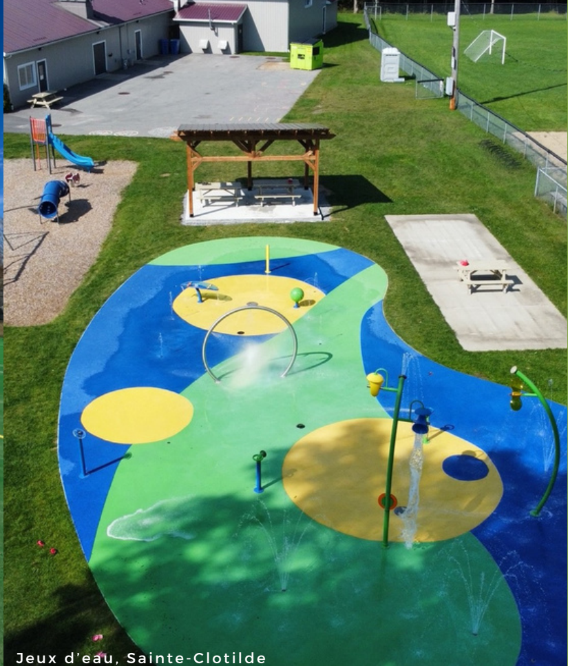
Jeux d'eau, Sainte-Clotilde