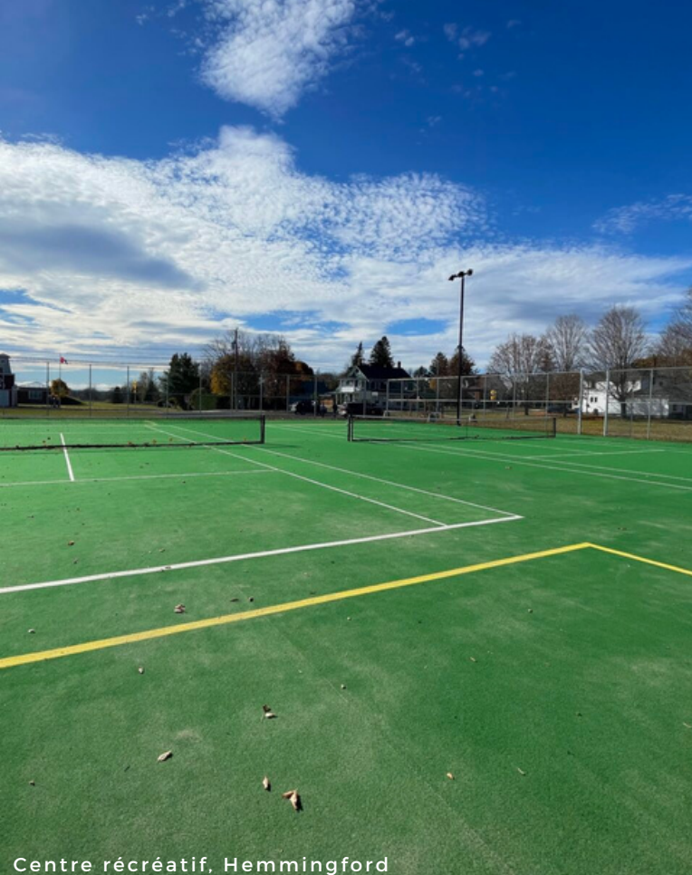
Centre récréatif, Hemmingford