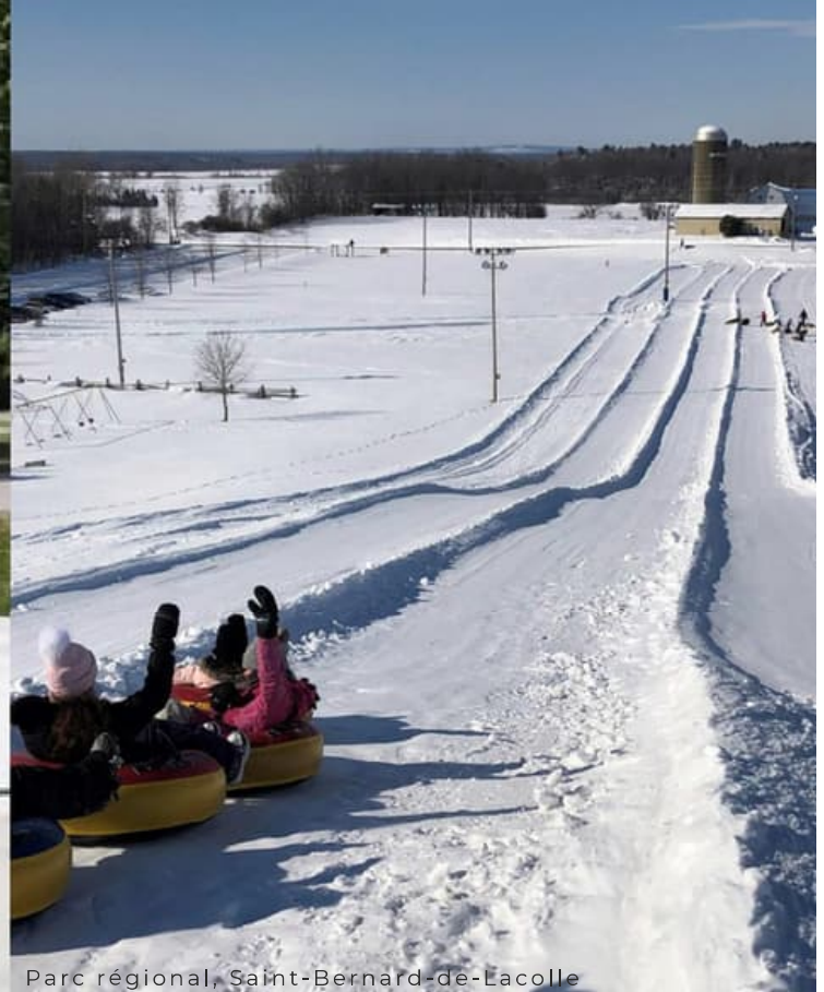
Parc régional, Saint-Bernard-de-Lacolle