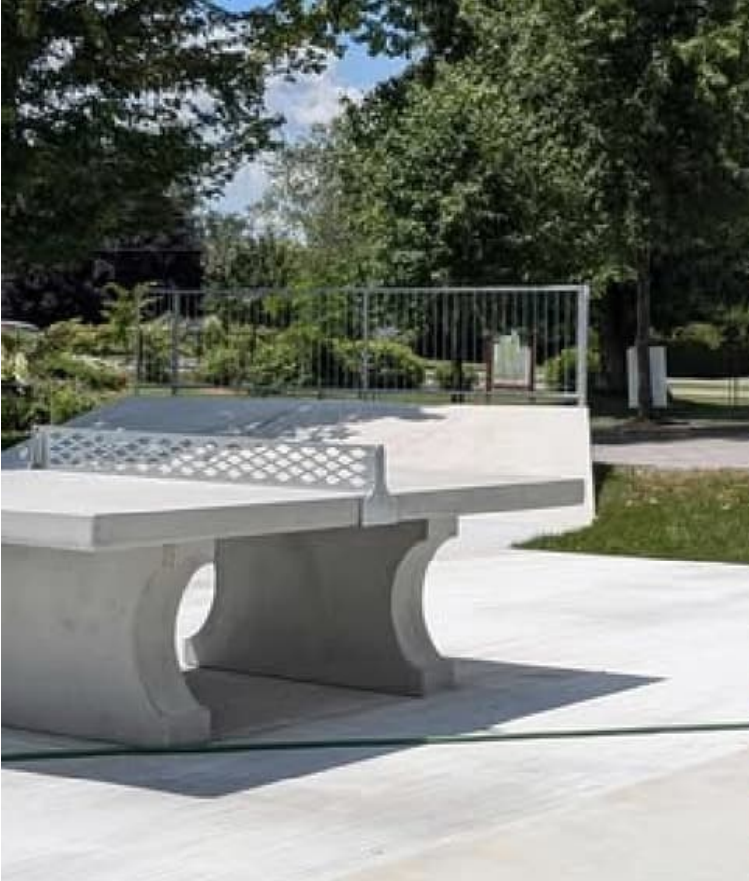
Parc Michel-Dumouchel, Saint-Cyprien-de-Napierville